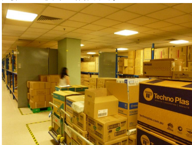
図 5 MMD の物品保管庫

K 病院の病棟や診療科への物品供給は MMD (Material Management Department) から行われる。薬品や薬剤用の物品は薬剤部に保管されるが、それ以外のすべての物品は購入後 MMD (図 5) に保管される。