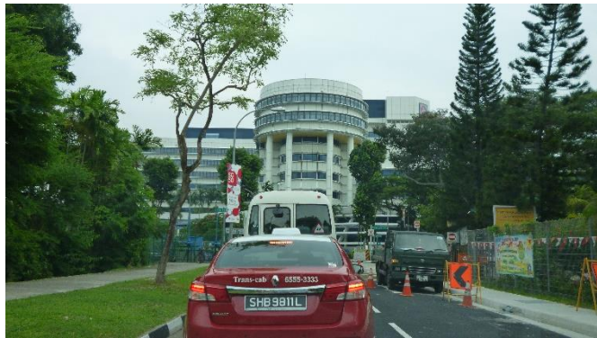
図 1 K 病院