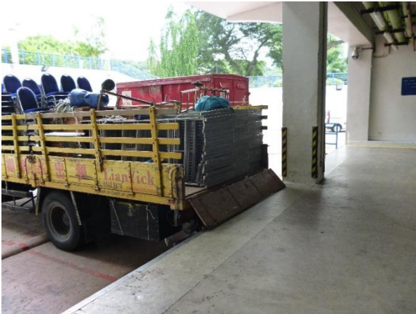
図 9 MMD に隣接する搬入口

MMD は K 病院内の 1 階に位置しており、搬入口と隣接している (図 9)。ゴミ類は他の搬出口から運び出されるため、これらの動線が交差することはない。物品の入った段ボール箱はここから隣接する MMD へと運び込まれ、受付を通過してから各収納スペースにて保管される。輸送段階でこれらの段ボールに細菌や害虫の卵が付着する可能性があり、どこで内容物を取り出すかがポイントになると考えられる。