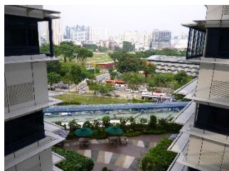
図 3 渡り廊下から街並みを見る