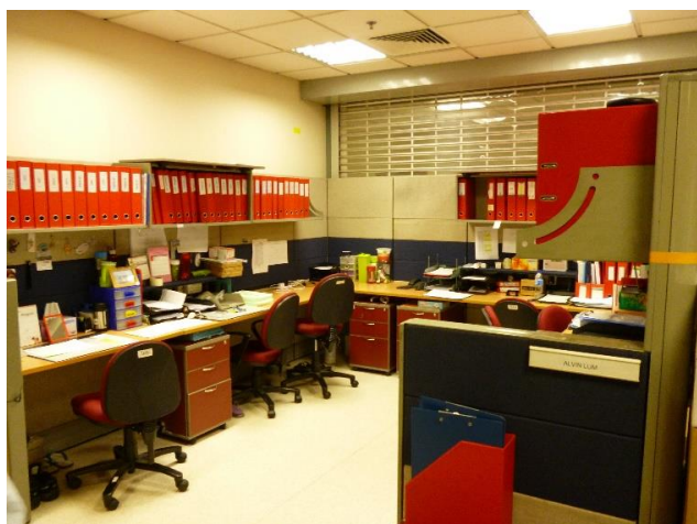
図 6 MMD スタッフの作業スペース

MMD は 9 名のスタッフで構成されており、2 名が物品の受け取り、書類作成、物品を要求するスタッフとの打ち合わせを行い、残りの 7 名が病院内に物品を供給するサポートを行う。図 6 は MMD 内の物品を管理するスタッフの作業スペースである。