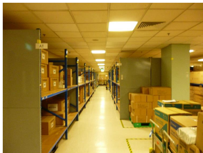
図 7 MMD の物品保管庫

MMD 内の棚には物品のコード、UOM (Unit of Measure)、MMD 内での位置情報と並んでバーコードのシールが貼られており、スキャナーで読み込むことでその物品に関する情報を表示する。一部の物品はシンガポール内の他の病院と同じコードで管理されており、病院間で物品の供給を行っている。また、図 7 の天井近くに見られる黄色いテープは、スプリンクラーの効果が阻害されずに、物品を積み上げることが可能な高さを示したものであり、全ての物品がテープより上の位置に保管されないように配慮されている。