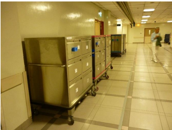
図 10 各部門に運ばれる部品