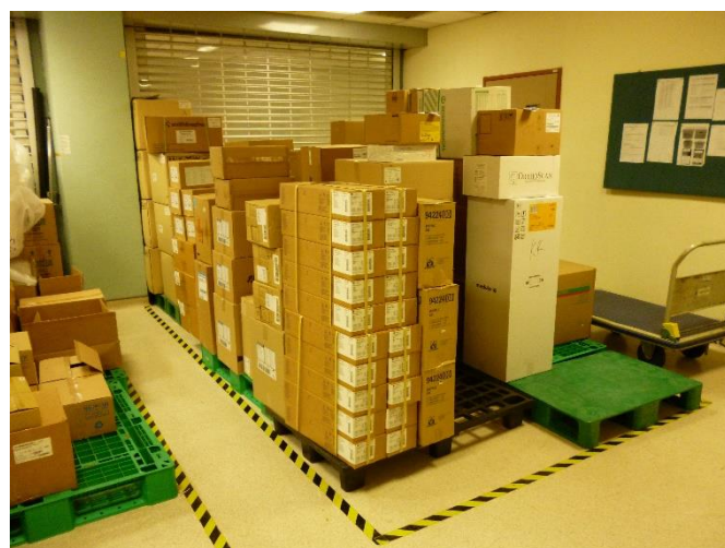
図 8 MMD の一角に積み上げられた手術部の物品

図 8 は MMD の一角に積み上げられた物品である。テープに囲われた箇所に積まれたこれらの段ボール箱は、手術室に運ばれる物品であるが、MMD のスタッフからは保管場所が足りていないとの指摘を受けた。MMD 内は保管用の棚の他に図 7、図 8 のように MMD 内の空いているスペースにテープでスタッフが通行可能なスペースを残しながら物品を保管している様子が見えがえた。