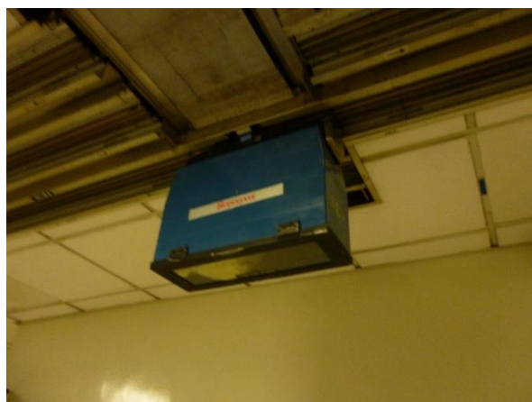
図 11 天井を走る自動運搬システム

MMD から院内の各部門へは図 10 のカートによって運ばれる。図のカートは診療部門に運ばれる物品である。また、院内には天井走行レールが通っており、自動システムにより各諸室に運ばれる (図 11)。